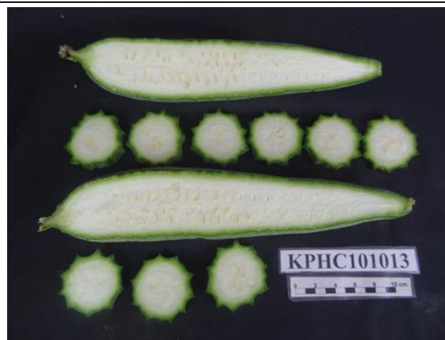
圖 2. 絲瓜 '高雄 5 號-愛戀' 食用果剖面。